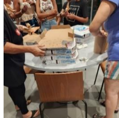
Residentes disfrutando de un "pizza night".

Los residentes de la comunidad se unieron para organizar un domingo de "pizza night". El personal de USI se encargó de notificar a las familias para que pudiesen participar del mismo.