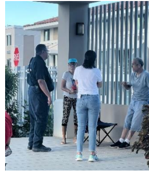
Oficial de Manejo de Emergencias y personal de USI evaluando residentes