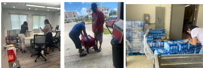
Water and food distribution by USI staff and MBM administrative staff.