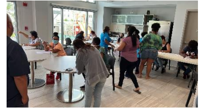
Distribución de certificados para alimentos por parte de municipio de San Juan.