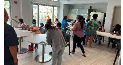
Voucher distribution from municipality of San Juan.