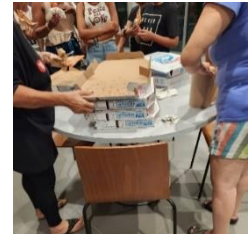
Residents enjoying pizza night

On Sunday, a day we couldn't provide hot meals, a group of residents came together and ordered pizza for the entire community. USI staff was able to outreach to all residents to share in this beautiful gesture.