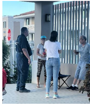
Emergency Management and USI Staff, evaluating residents during the emergency and power outage.

-Health Checkups: staff of Emergency Management visit Renaissance Square to check up on residents with chronic health conditions to provide oxygen refill and transportation to medical facilities if needed.