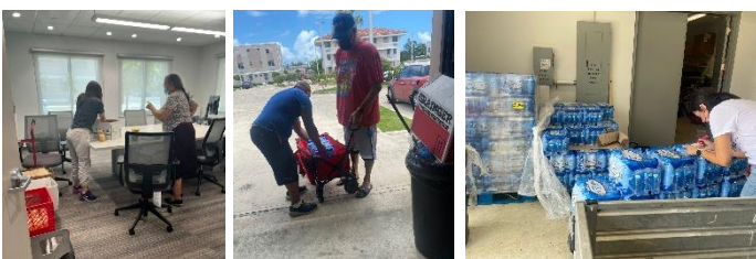
Distribución de almuerzos calientes y agua potable con personal de USI y MBM.

-Visita de Personal Médico a familias de alto riesgo: personal de Manejo de Emergencias visitó pacientes con condiciones de salud y respiratorias crónicas para asegurar tuviesen recursos necesarios y ofrecer traslado a facilidades médicas de ser necesario.